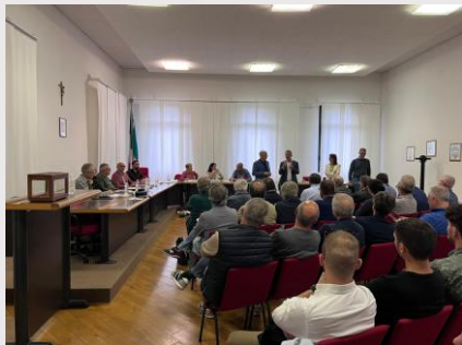
CONSIGLIO APERTO A SANT'URBANO 2024

Il Consiglio direttivo è il principale organo collegiale per Ordini e Collegi, espressione diretta dell'assemblea degli iscritti che ne elegge i membri; a esso sono attribuiti i poteri per il governo della professione.